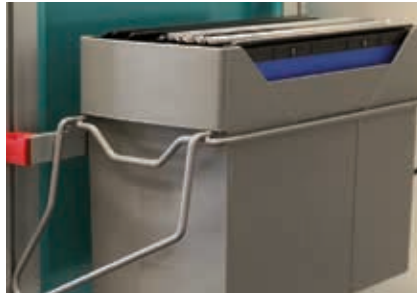
TPC contenitore porta cartelle