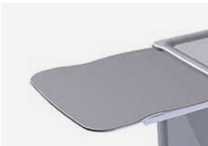
PRE-PRB piano laterale a ribalta