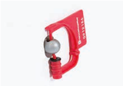
SG sigillo numerato in plastica rossa, numerato