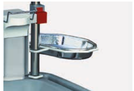
PCMBR supporto per arcella