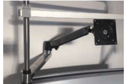
SERG braccio regolabile porta monitor