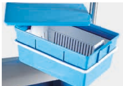
PCMVD supporto per vaschetta disinfezione strumenti