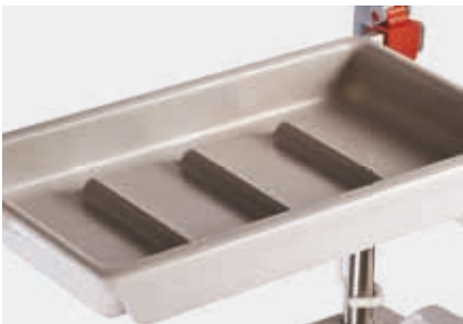
VA-D mensola in plastica per sopraalzo