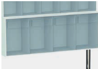
PCMCR4C cassettiera per sopraalzo a 4 elementi