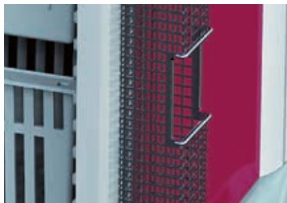
CLCS porta cateteri in inox