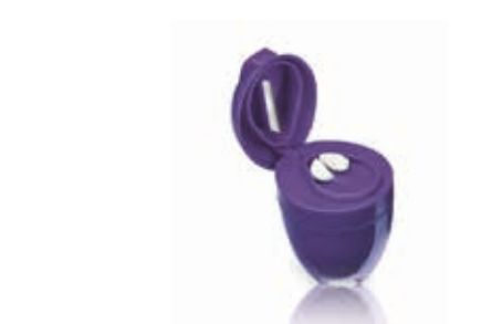
NON DIMENTICARE IL NOSTRO TAGLIA-TRITA-PORTA PILLOLE CRUSHY