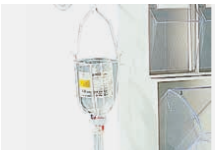
PCMF gancio flebo